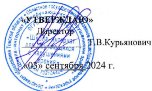
График оценочных процедур на I полугодие 2024/2025 учебного года в 1-4д классах